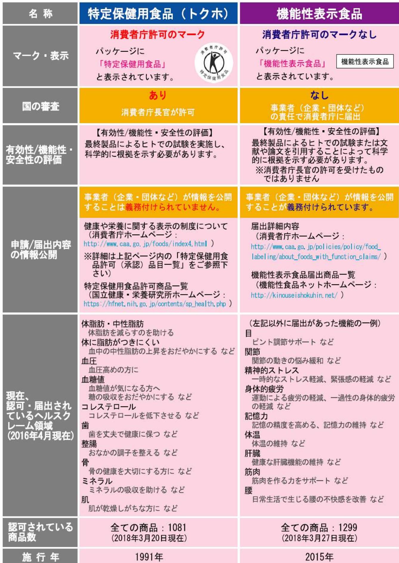
（表2）特定保健用食品と機能性表示食品の違い