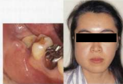
骨膜炎を惹発する。