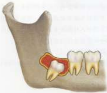
含歯性嚢胞を形成する。