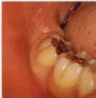
他の歯を押し出して歯列不正が生じる (症例はア舌側傾斜)。