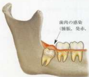
歯肉の感染 (腫脹、発赤、疼痛)