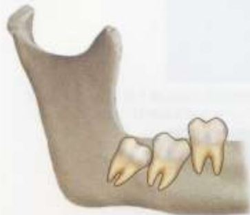
第二大臼歯に萌出異常を起こさせる。