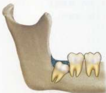
炎症のため智歯周囲の骨が吸収する。 第二大臼歯の歯根が吸収する。 第二大臼歯遠心に非可逆的な歯周ポケットが形成される。