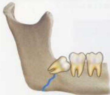
下顎角部の骨折を起こしやすい。