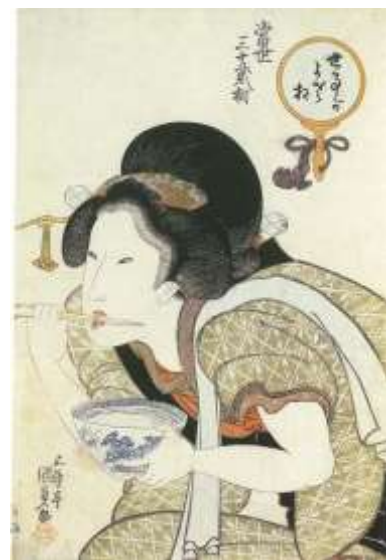
当世三十二相 世事がよさ相 歌川国貞

おもしろいですよね。そして、今回のテーマの「奥歯にものがはさまったような」ですが、これは思うことを率直に言わないことです。