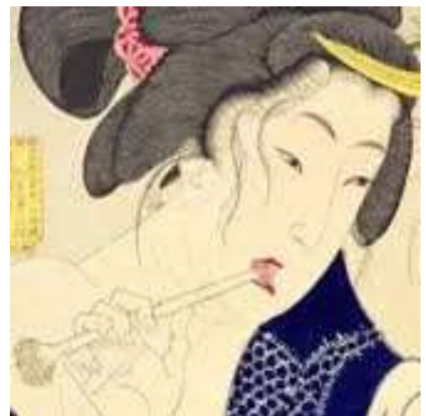
めがさめさう 月岡芳年